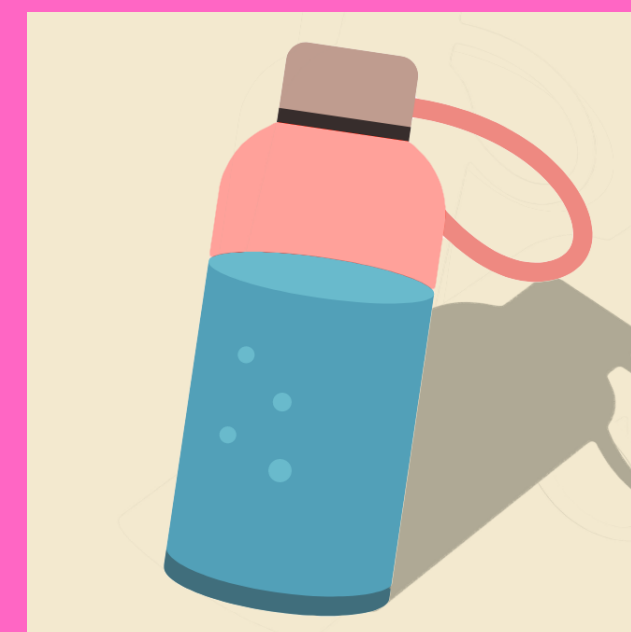
1 bouteille d'eau réutilisable