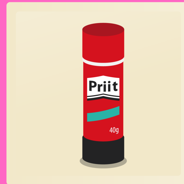
2 bâtons de colle 40g