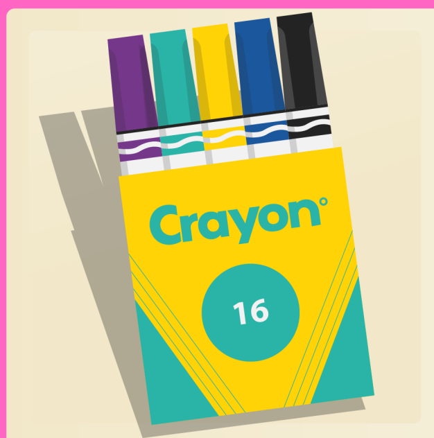
2 boîtes de 16 marqueurs lavables (couleurs originales)