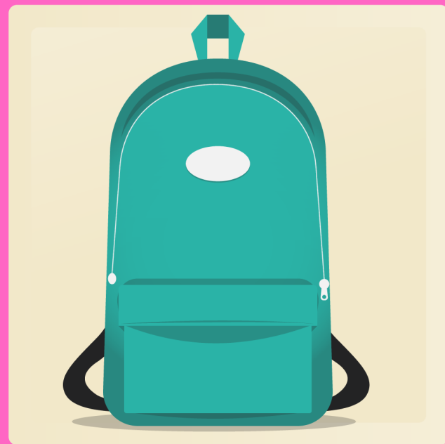
1 grand sac à dos (avec fermeture éclair)