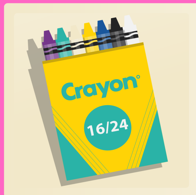
16 ou 24 crayons de cire