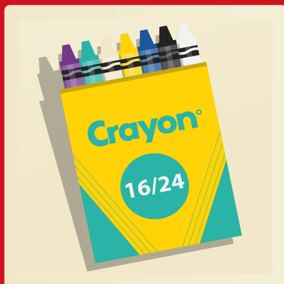
24 crayons de cire