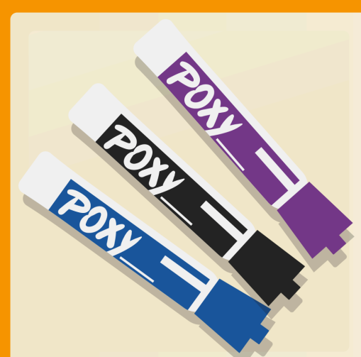
2 crayons effaçables à sec