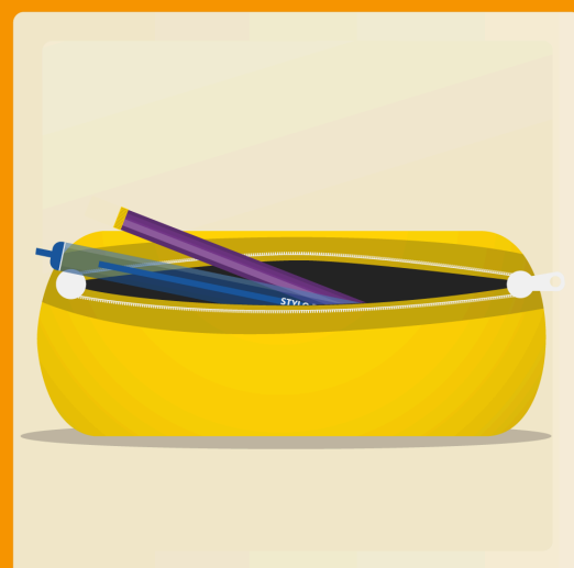
1 étui à crayon souple ou en plastique