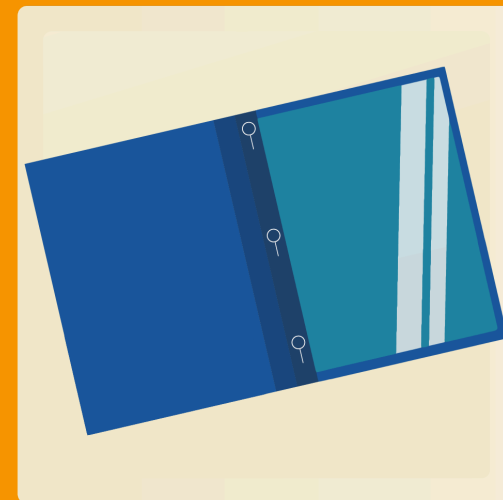
8 duo-tangs avec 3 attaches