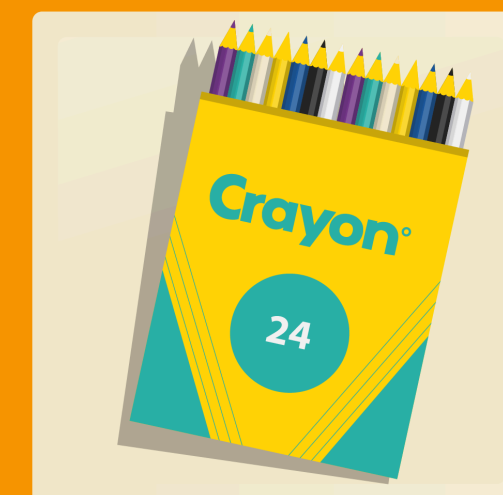
24 crayons de bois