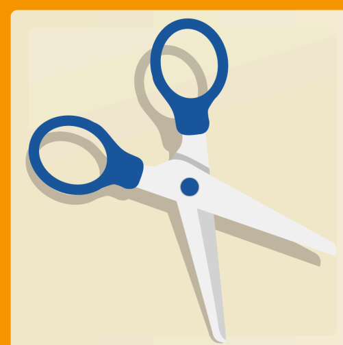
1 paire de ciseaux à bouts ronds