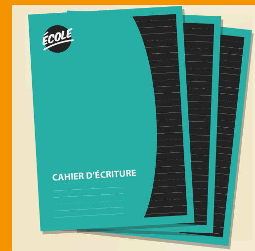
3 cahiers d'écriture avec pointillés #12182