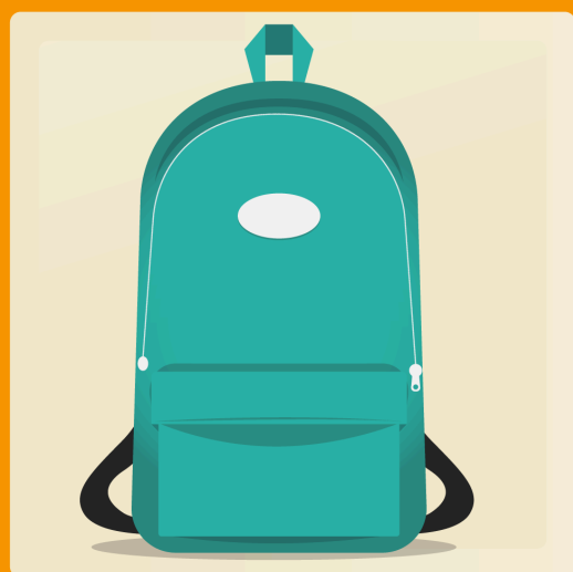
1 sac à dos