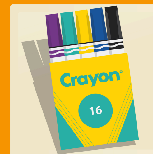
16 marqueurs lavables à traits larges