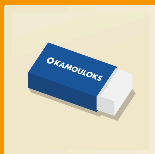
4 gommes à effacer