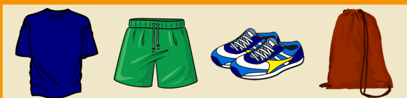
Éducation physique: 1 sac en tissu contenant: 1 short, 1 chandail à manches courtes, 1 paire de souliers de course