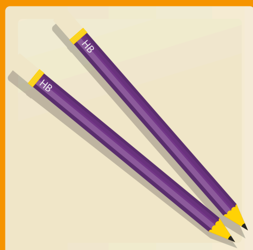
24 crayons à la mine HB aiguisés