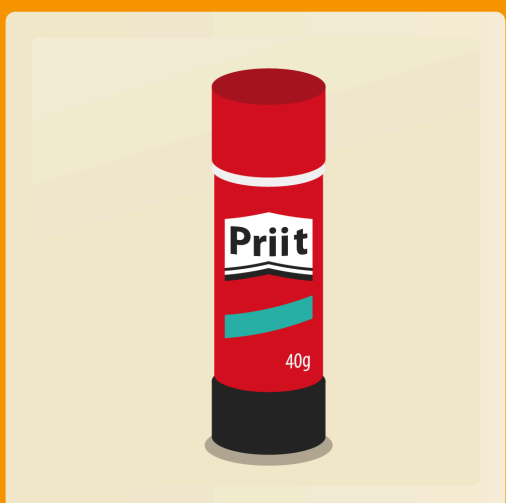
2 bâtons de colle 40g