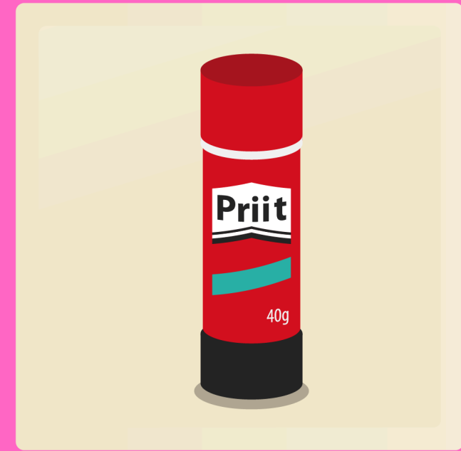
2 bâtons de colle 40g