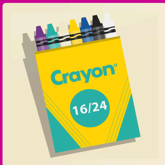
24 crayons de cire