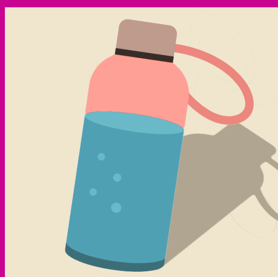
1 bouteille d'eau réutilisable