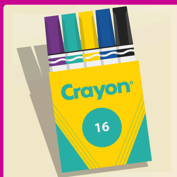
2 boîtes de 16 marqueurs lavables