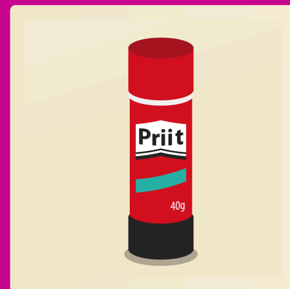
3 bâtons de colle 40g