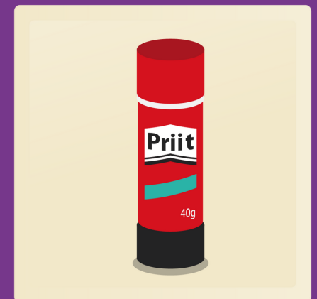
2 bâtons de colle 40g