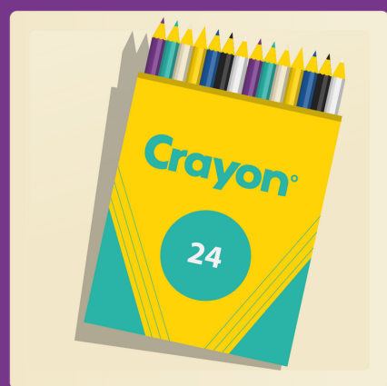
12 ou 24 crayons de couleur de bois