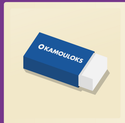
3 gommes à effacer