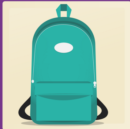
1 sac à dos