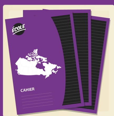
8 cahiers Canada