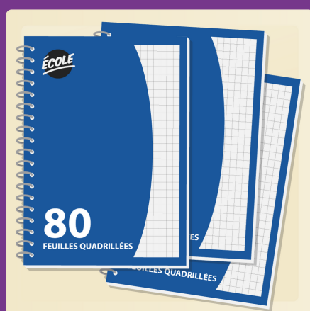
1 cahier quadrillé spirale 80 pages (1 cm x 1 cm)