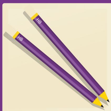
24 crayons à la mine HB