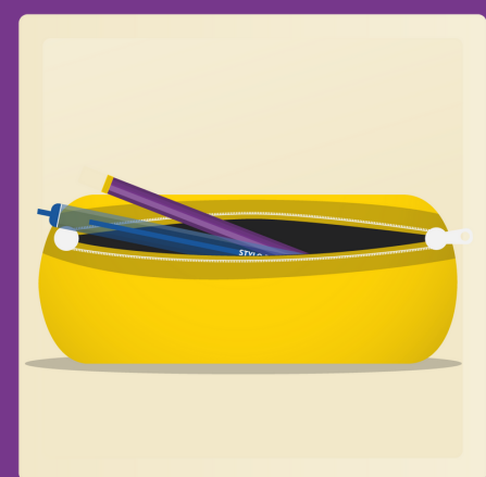
1 étui à crayon souple