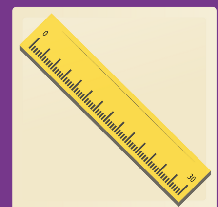
1 règle de 30 cm

1 sac en tissu contenant: 1 short, 1 chandail à manches courtes, 1 paire de souliers de course