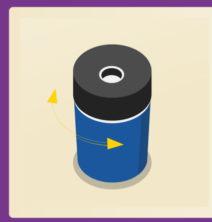
1 taille-crayon qui se visse