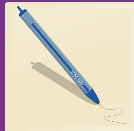
2 stylo bleu