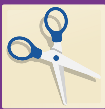
1 paire de ciseaux