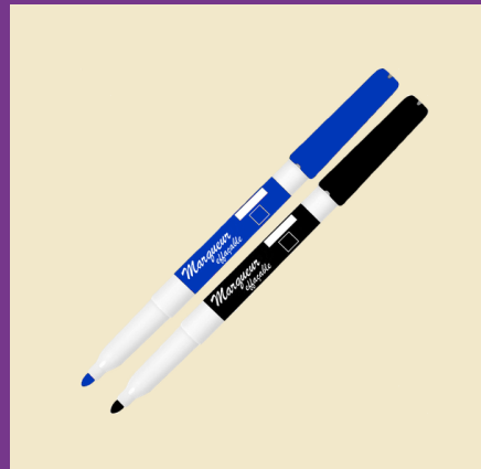
2 crayons effaçables à sec à pointe fine