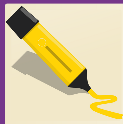
1 surligneur jaune