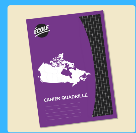
1 cahier Canada quadrillé 1cm