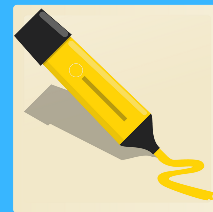
6 surligneurs (jaune, bleu, orange, rose, vert et mauve)