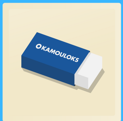
3 gommes à effacer