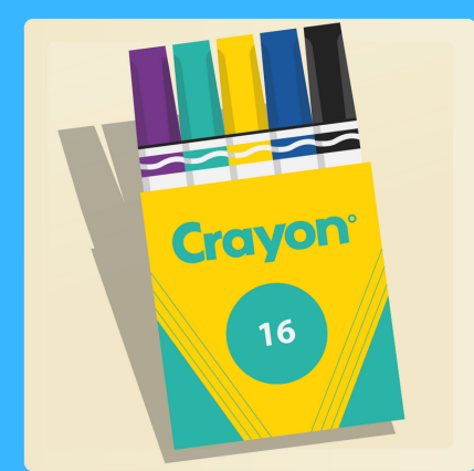
12 marqueurs lavables