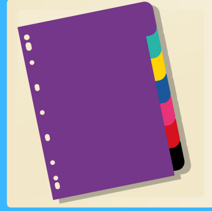
1 paquet de 5 index séparateurs