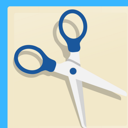
1 paire de ciseaux