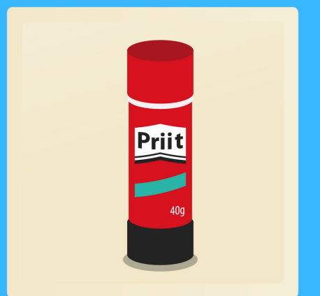
2 bâtons de colle 40g