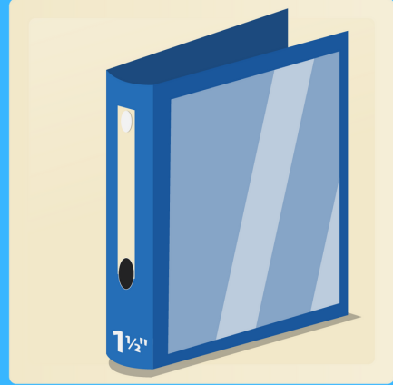
1 cartable 1"