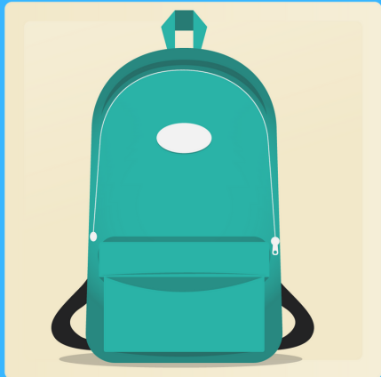
1 sac à dos