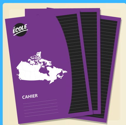
8 cahiers Canada