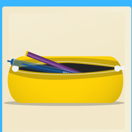
1 étui à crayon