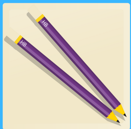
24 crayons à la mine HB