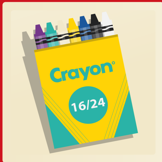
24 crayons de cire