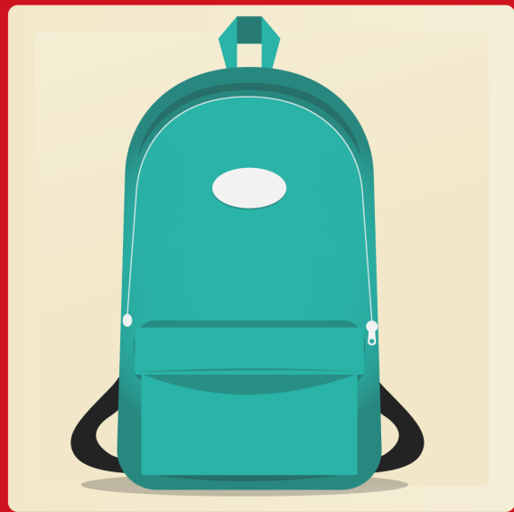
1 grand sac à dos