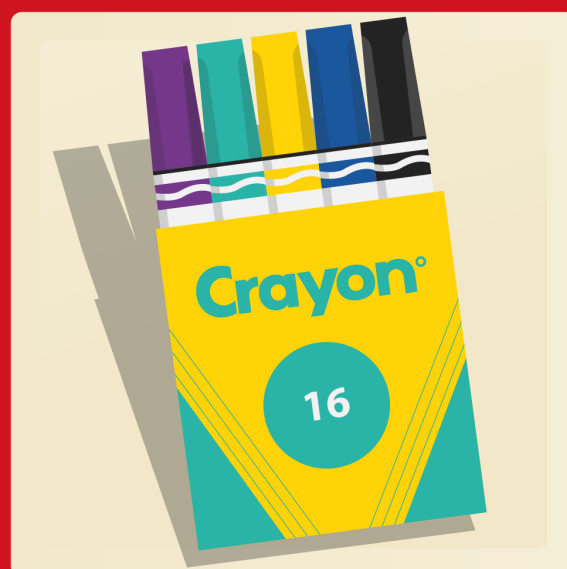
2 boîtes de 16 marqueurs lavables