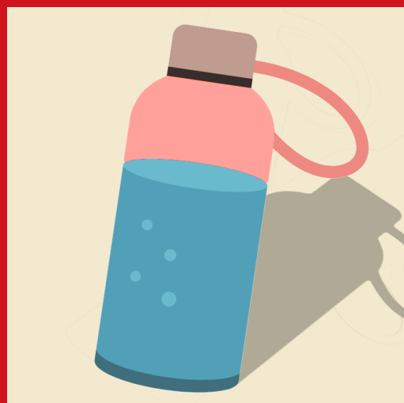
1 bouteille d'eau réutilisable