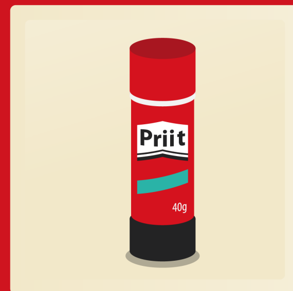
3 bâtons de colle 40g